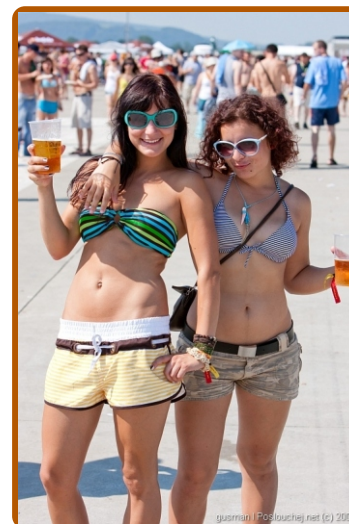
Bažant Pohoda 2009