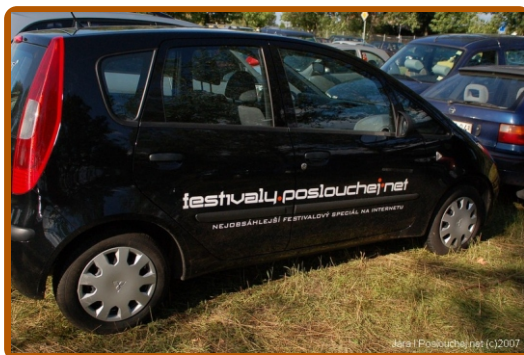
Rock For People 2007